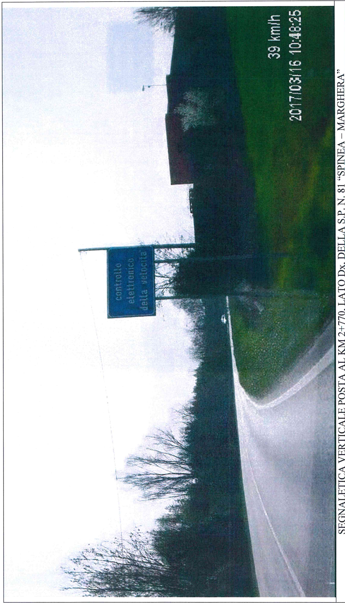
SEGNALETICA VERTICALE POSTA AL KM 2+770, LATO Dx, DELLA S.P. N. 81 "SPINEA - MARGHERA"