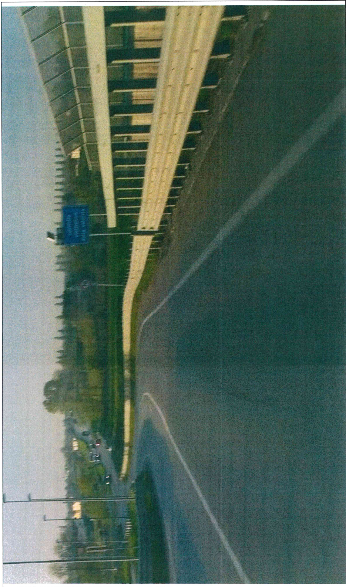
SEGNALETICA VERTICALE POSTA AL KM 3+524, LATO Dx, DELLA S.P. N. 81 "SPINEA - MARGHERA"