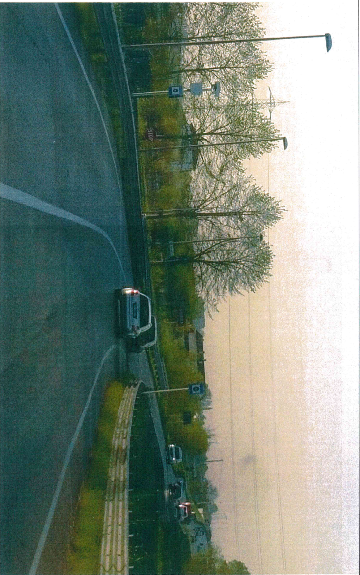
DISPOSITIVO N. 198 POSTO AL KM 3+641 CON SEGNALETICA VERTICALE , LATO SX, DELLA S.P. N. 81 “SPINEA – MARGHERA”