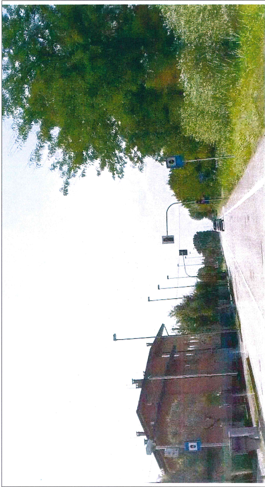
DISPOSITIVO matr. N. 201 POSTO AL KM 9+105 CON SEGNALETICA VERTICALE , LATO dx, DELLA S.P. N. 32 "MIRANESE"