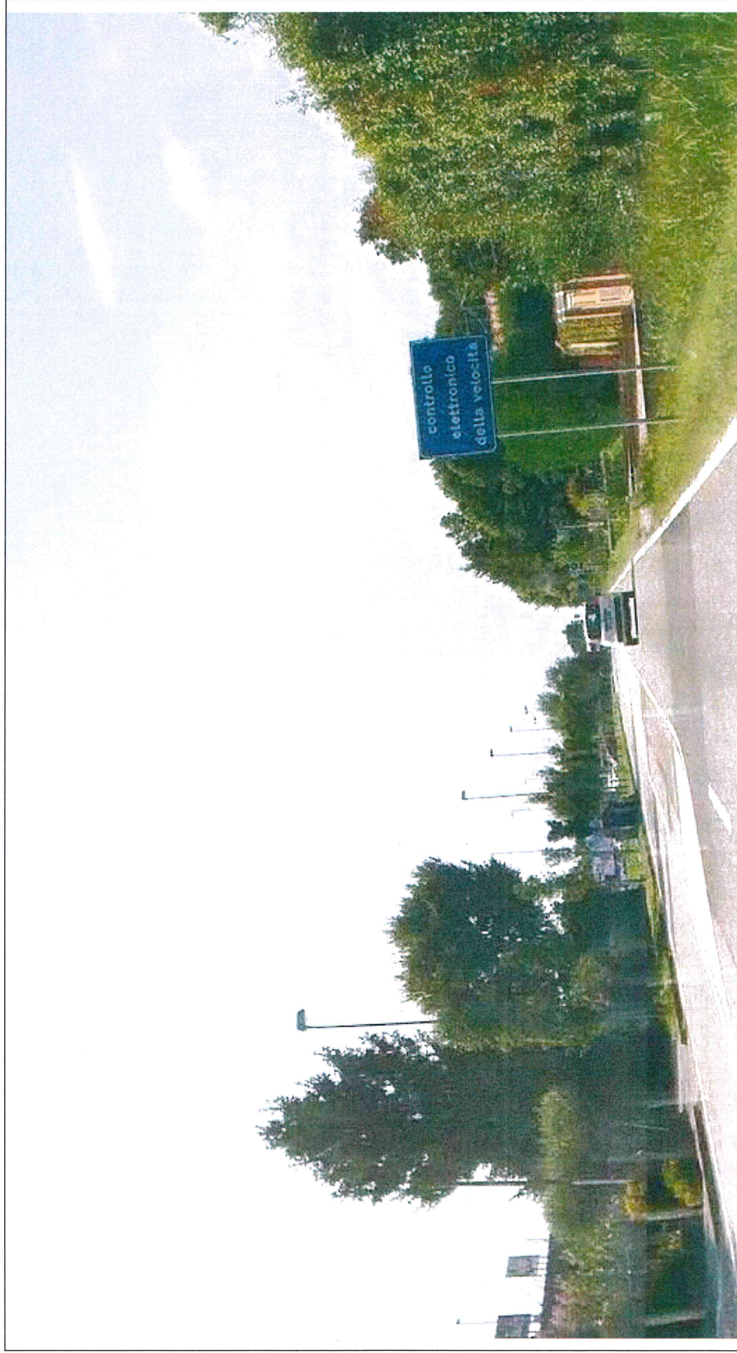
SEGNALETICA VERTICALE POSTA AL KM 8+698, LATO dx, DELLA S.P. N. 32 "MIRANESE"