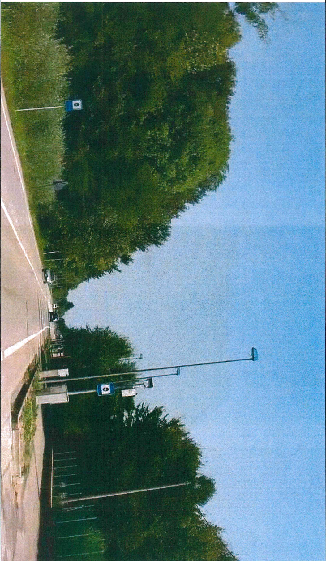
DISPOSITIVO matr. N. 201 POSTO AL KM 9+105 CON SEGNALETICA VERTICALE , LATO SX, DELLA S.P. N. 32 “MIRANESE”