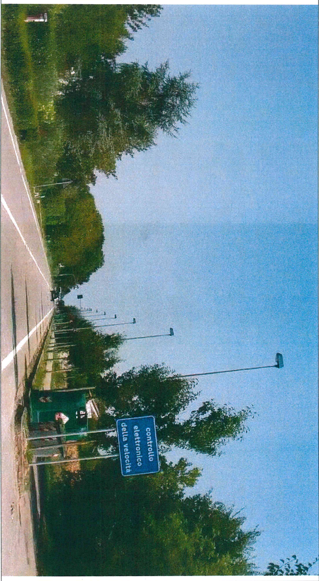
SEGNALETICA VERTICALE POSTA AL KM 9+378, LATO Sx, DELLA S.P. N. 32 "MIRANESE"