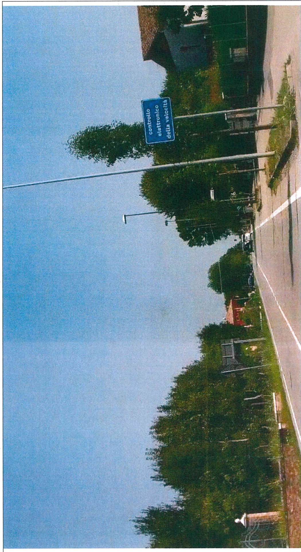
SEGNALETICA VERTICALE POSTA AL KM 9+647, LATO Sx, DELLA S.P. N. 32 "MIRANESE"