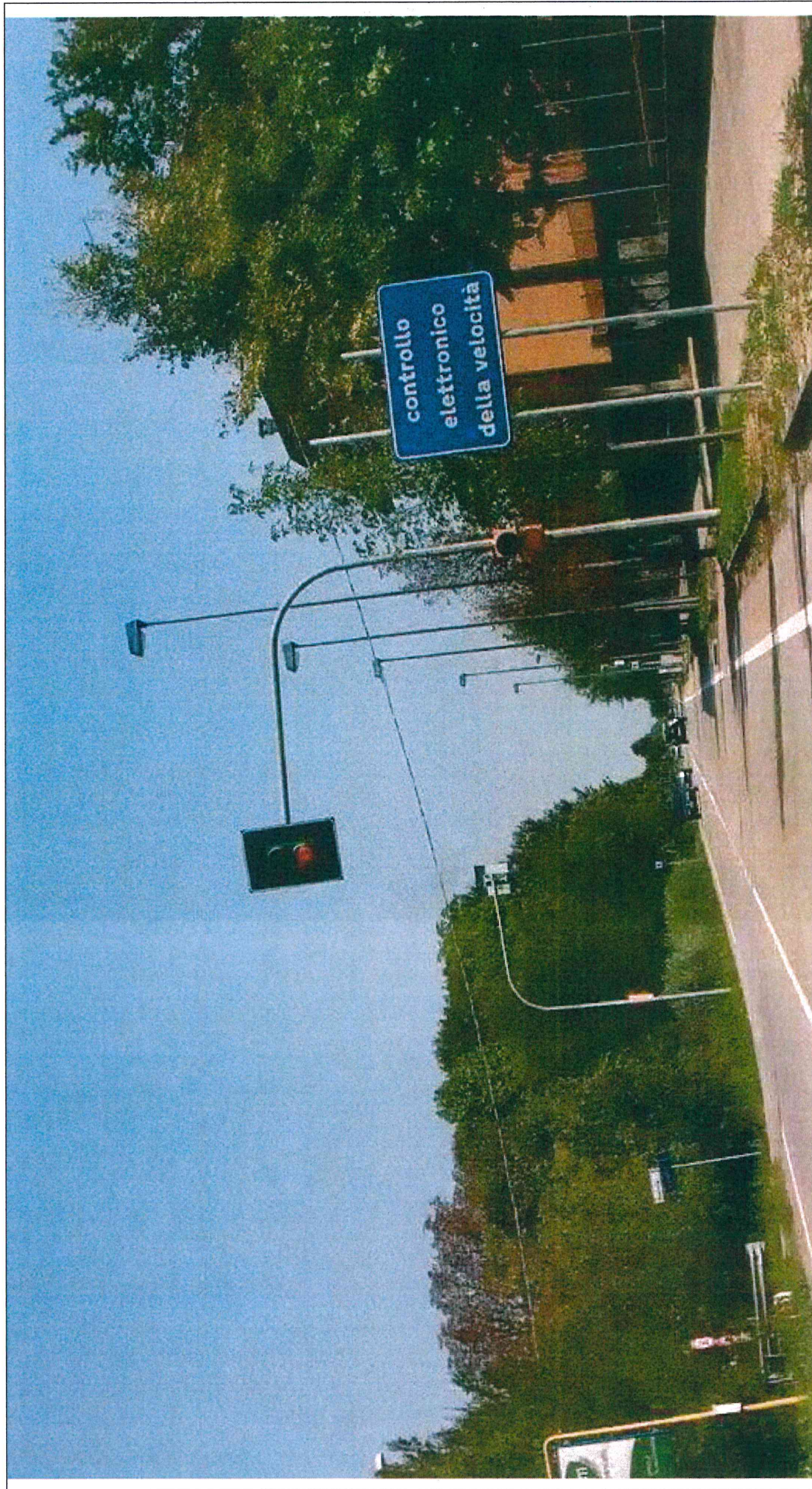
SEGNALETICA VERTICALE POSTA AL KM 9+203, LATO Sx, DELLA S.P. N. 32 "MIRANESE"