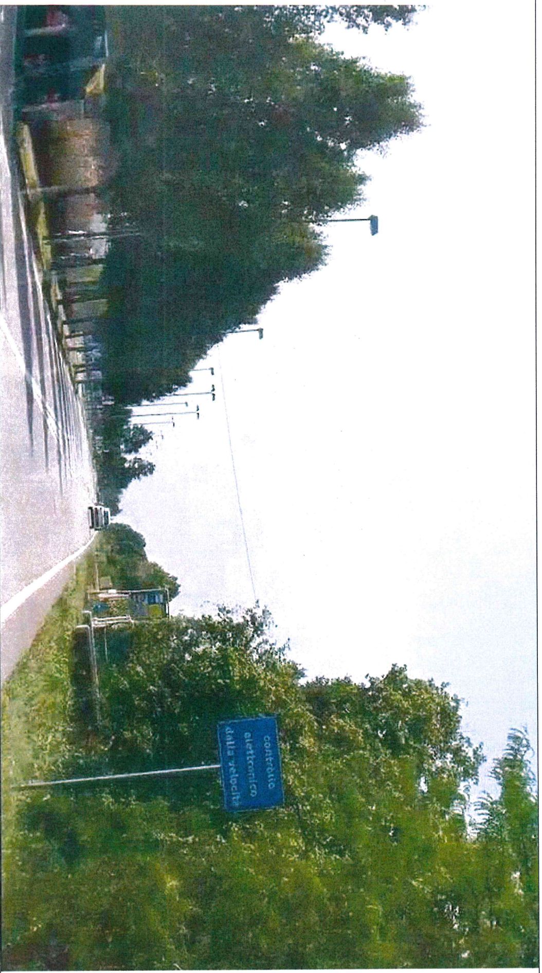
SEGNALETICA VERTICALE POSTA AL KM 8+281, LATO dx, DELLA S.P. N. 32 "MIRANESE"