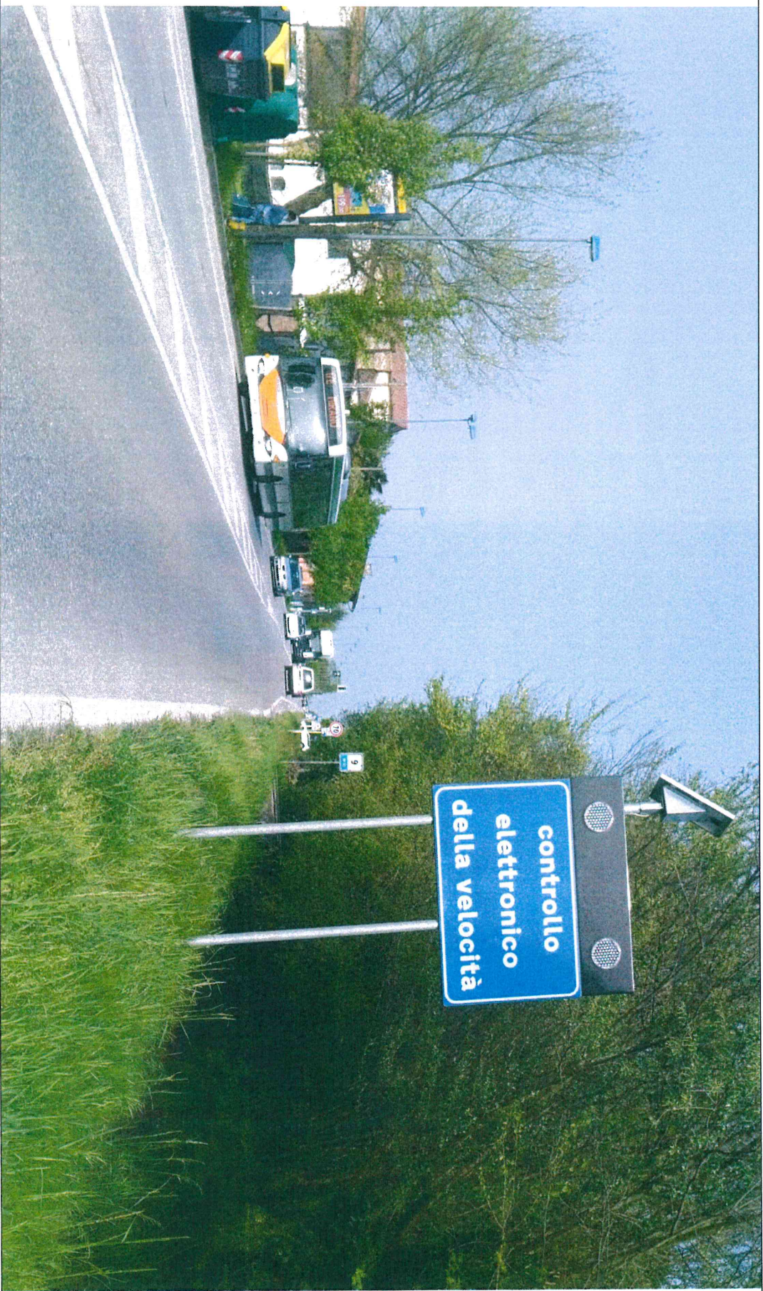
SEGNALETICA VERTICALE POSTA AL KM 8+967, LATO dx, DELLA S.P. N. 32 "MIRANESE"