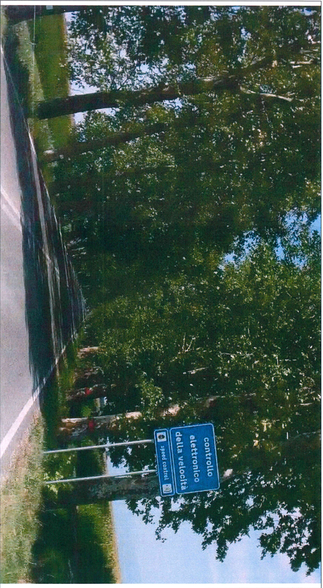
SEGNALETICA VERTICALE POSTA AL KM 10+070, LATO SX, DELLA S.P. N. 59