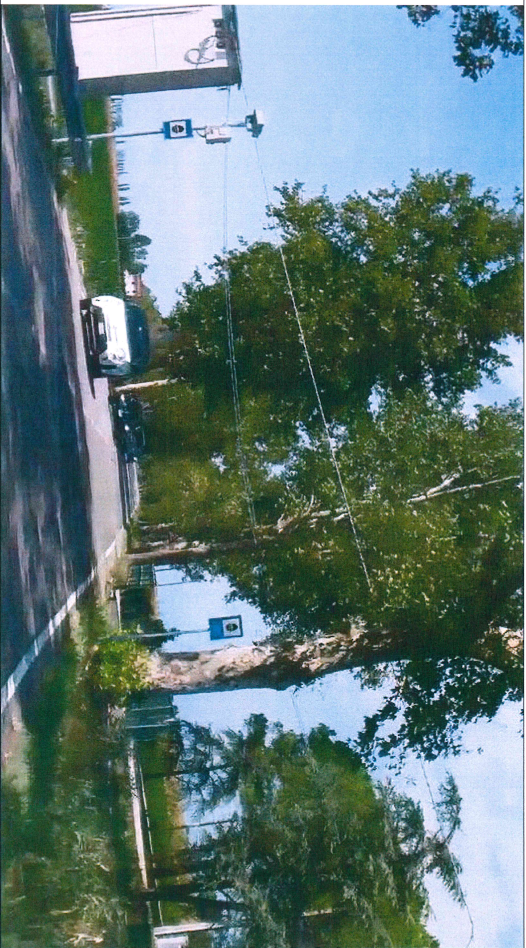
DISPOSITIVO matr. N. 214 POSTO AL KM 7+312 CON SEGNALETICA VERTICALE , LATO dx, DELLA S.P. N. 59