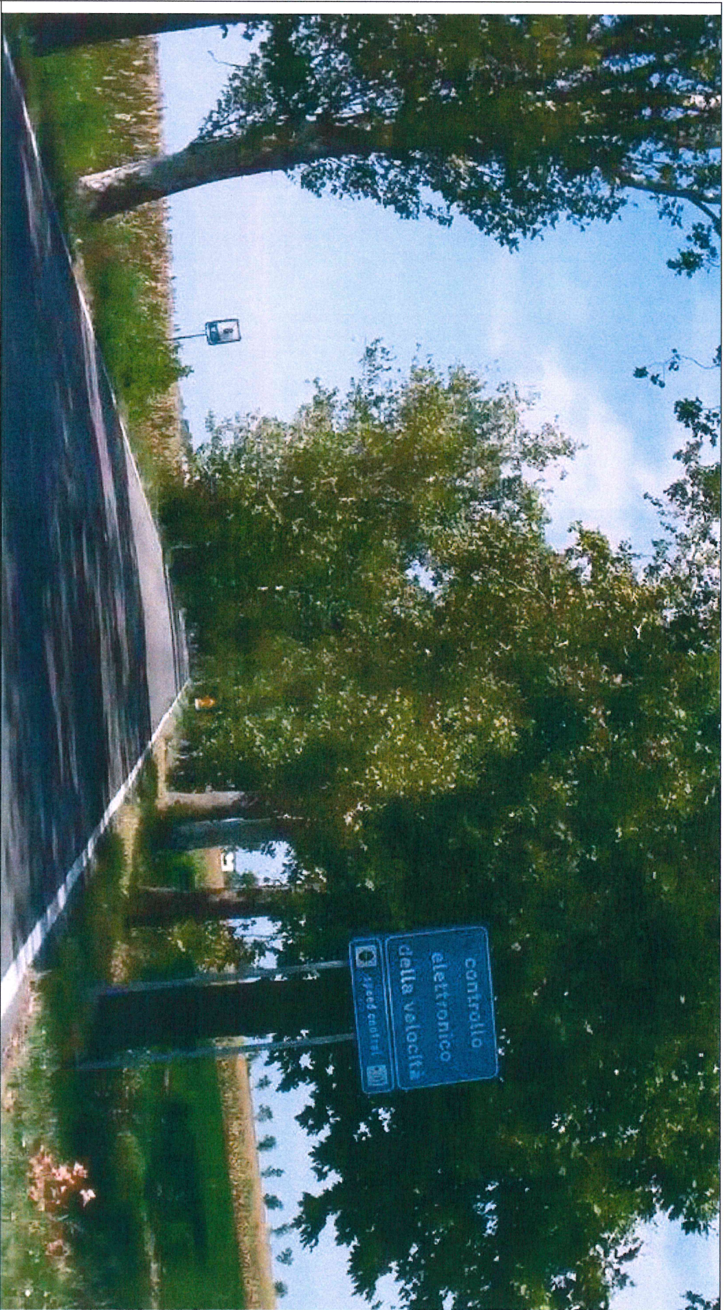
SEGNALETICA VERTICALE POSTA AL KM 8+023, LATO SX, DELLA S.P. N. 59